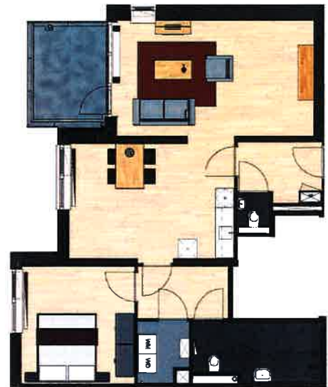
Vinkenstraat 124, 134, 144, 154, 164