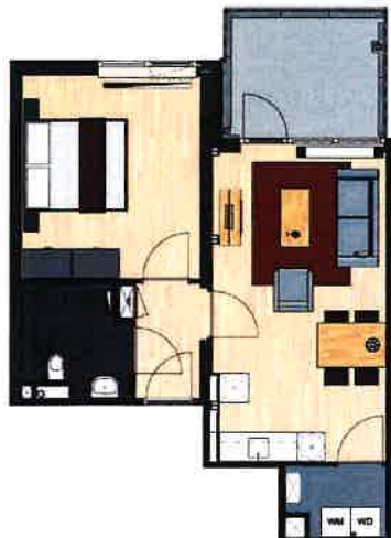
Vinkenstraat 130, 140, 150, 160, 170, 180