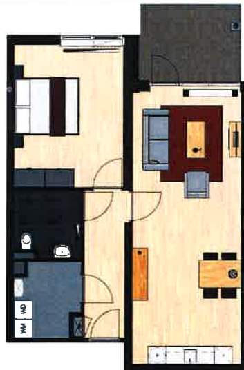
Vinkenstraat 118, 128, 138, 148, 158, 168, 178