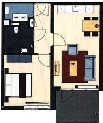
Vinkenstraat 112, 122, 126, 132, 136, 142, 146, 152, 156, 162, 166, 172, 176